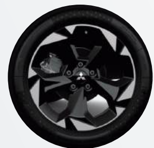
18" Leichtmetallfelgen ▲ Diamanten-cut in silber/schwarz Intense, Diamond