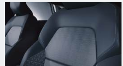
Die Abbildung zeigt Invite HEV