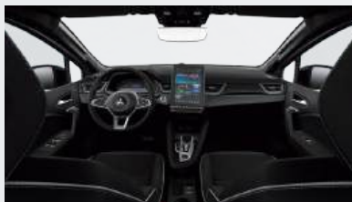
Die Abbildung zeigt Diamond