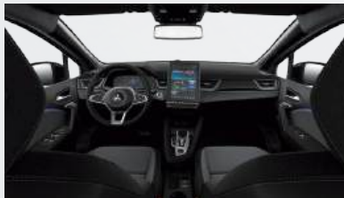
Die Abbildung zeigt Intense HEV