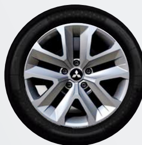
17" Flex Wheel ▲ Stahlfelge mit Spezial-Zierkappe Inform, Invite

mit Dach in Onyx Schwarz ab Ausstattung INTENSE € 500,-